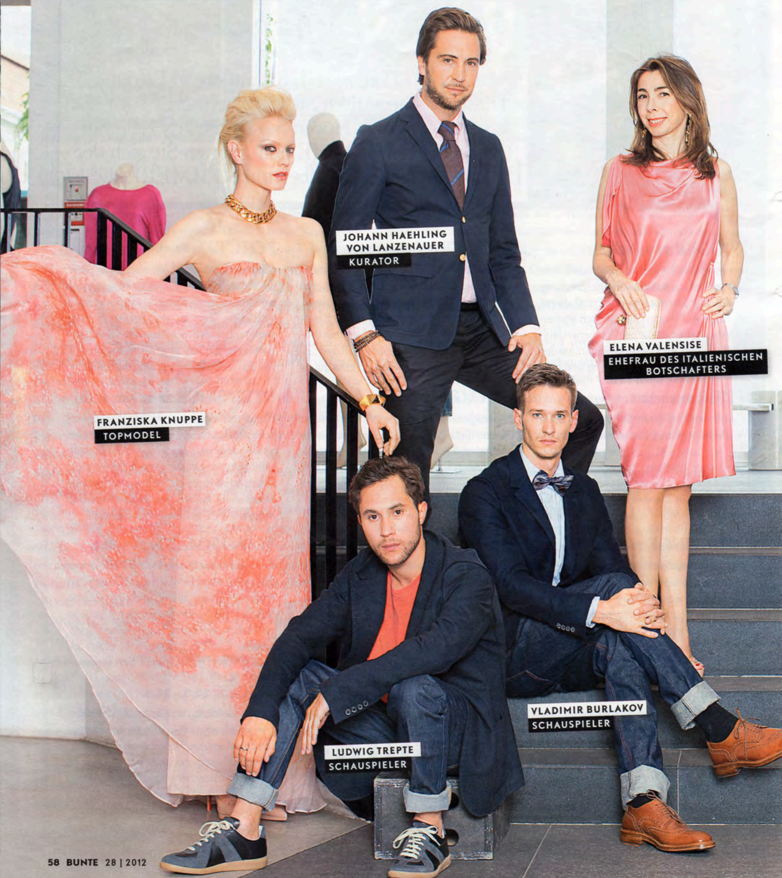
FRANZISKA KNUPPE TOPMODEL